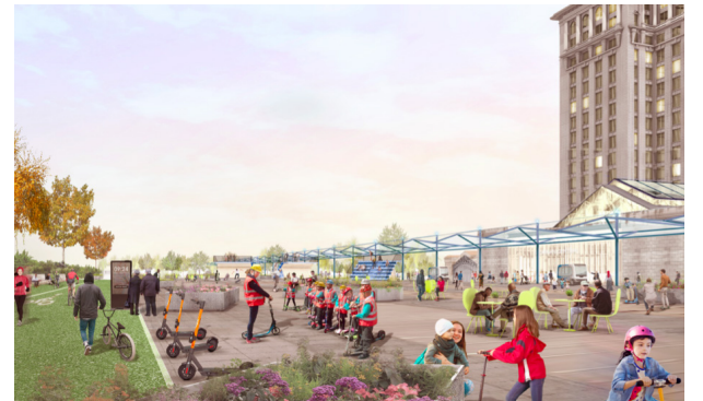
The former train platform will be transformed into a versatile landscape for the public to experience new mobility solutions and technologies.

Remediation work begins this month on the old train platform behind Michigan Central Station as we prepare for a new mobility platform. This new public space will feature outdoor amenities and mobility testing capabilities.