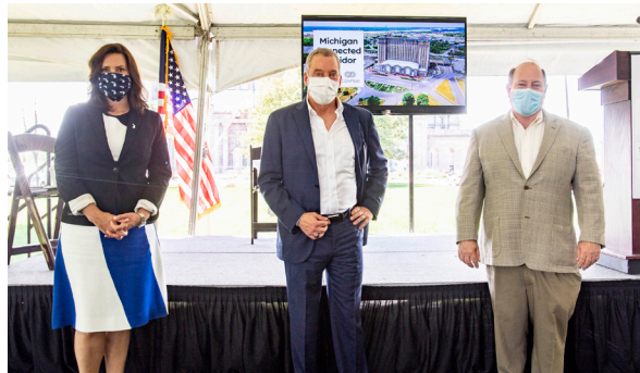
La Gobernadora Gretchen Whitmer, el Director Ejecutivo Bill Ford y el Alcalde Mike Duggan anuncian el Corredor Conectado De Michigan

El mes pasado, la Gobernadora de Michigan, Gretchen Whitmer, anunció una nueva iniciativa para desarrollar un corredor o carretera, única en su clase, para vehículos computarizados y autónomos (CAV) que preparará el camino para las carreteras del futuro.