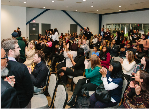
High School students from Mercy Education Project were among the winners of the Ford MCS City:One Challenge.