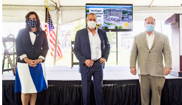
Gov. Gretchen Whitmer, Exec. Chairman Bill Ford, Mayor Mike Duggan announce Michigan Connected Corridor

Last month Michigan Governor Gretchen Whitmer announced a new initiative to develop a first-of-its-kind corridor for connected and autonomous vehicles (CAV) that will pave the way for the roads of the future.