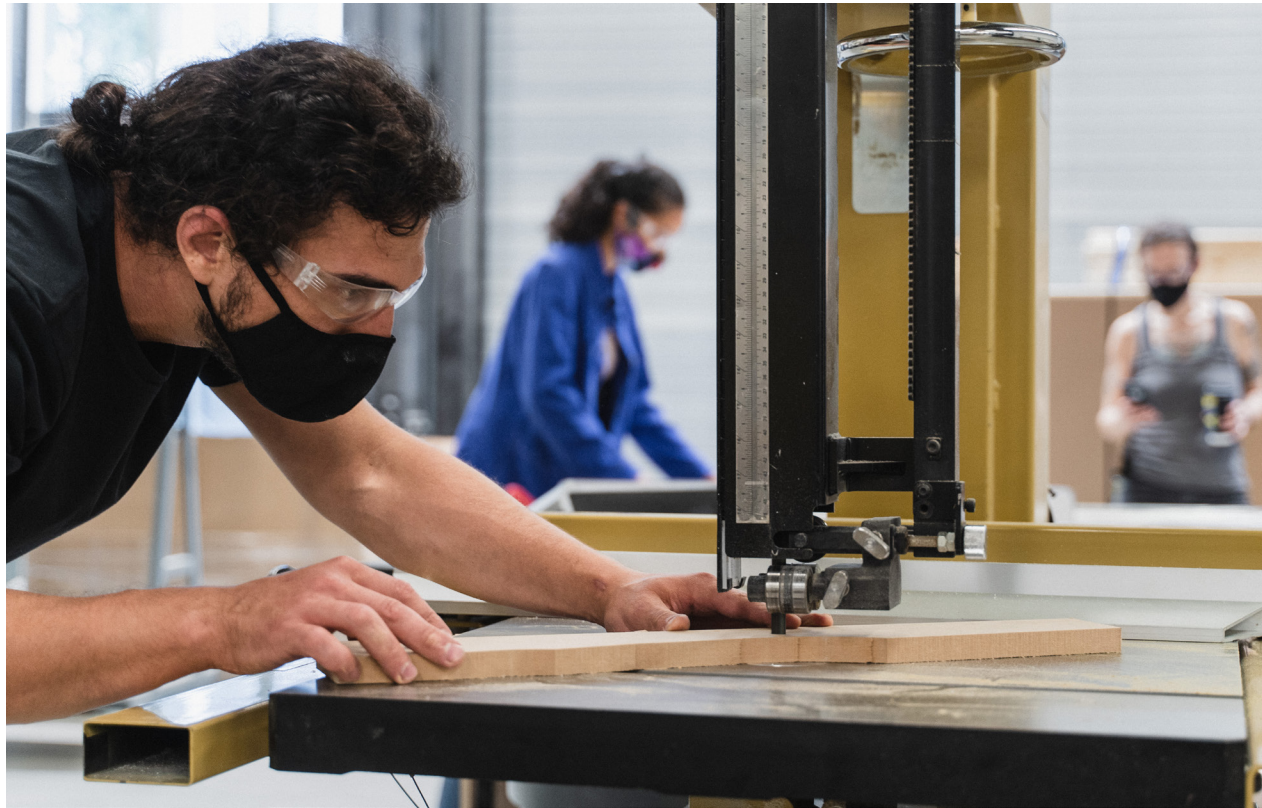
Michigan Central collaborates with Newlab to launch a new civic studio to make neighborhoods more accessible. Above: Studio participants working at Newlab's prototyping facility in Brooklyn, NY